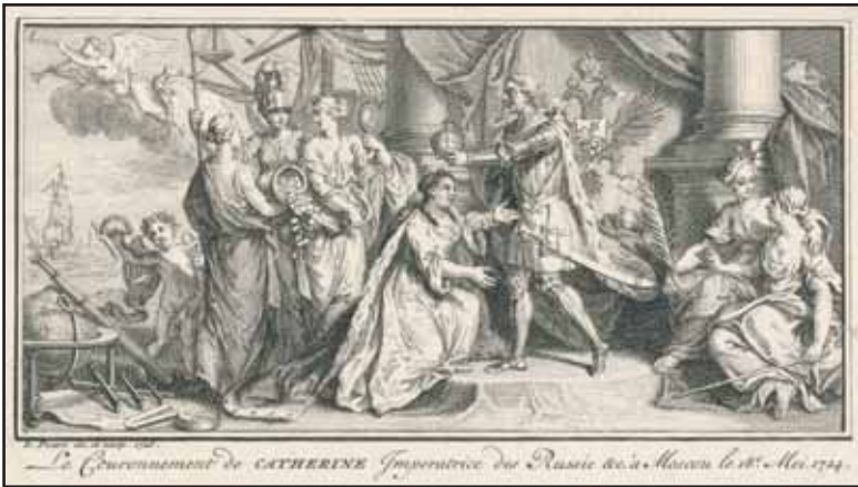
Петр коронует Екатерину императрицей. Гравюра Бернара Пикара (1673–1733). Государственный музей (Рейксмузеум), Амстердам

сами определяли, с кем она видится и кто может через нее как-то повлиять на государя. На практике они продавали право доступа к императрице за большие деньги.