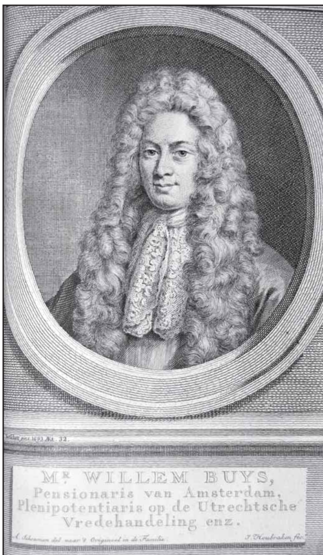
Виллем Бейс. Частная коллекция Ханса ван Конингсбрюгге. Фото: Николас Крафт ван Эрмел