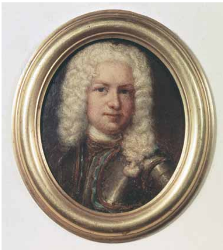
Георг Хайнрих фон Гёртц. Портрет работы неизвестного художника. Национальный музей, Стокгольм

ва Тессел, что вызвало на амстердамской бирже настоящее потрясение. Корабли были, правда, небольшие, но им все же удалось захватить три голландских судна 15 . Под влиянием всех этих событий амстердамское адмиралтейство постановило вышеупомянутый фрегат приковать цепью к пристани, а находящихся на его борту шведов интернировать.