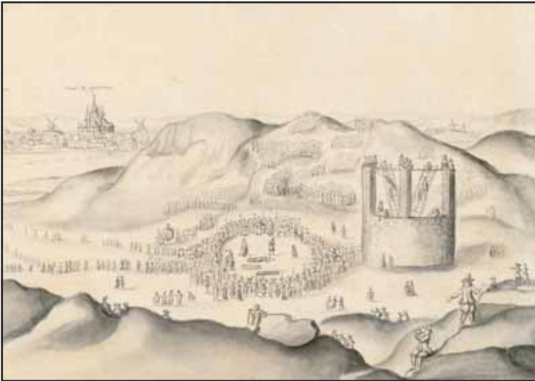
Казнь барона фон Гёртца. Рисунок неизвестного художника. Национальный музей, Стокгольм

И тут Республика Соединенных Нидерландов могла сыграть немаловажную роль. Созная это, посланник ландграфа Гессен-Кассельского в Гааге обратился в начале января 1719 г. к великому пенсионарию Хейнсиусу с просьбой о вмешательстве голландцев