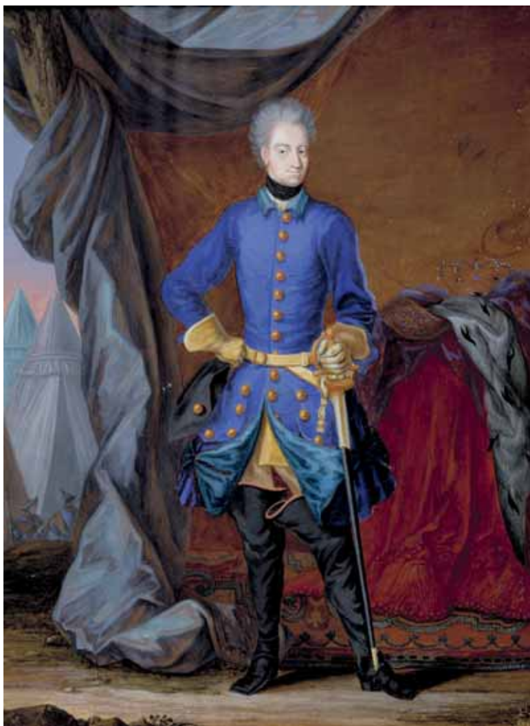
Карл XII. Портрет работы неизвестного художника. Национальный музей, Стокгольм