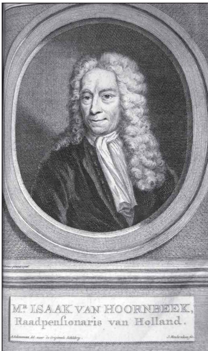
Исаак ван Хорнбейк. Частная коллекция Ханса ван Конингсбрюгге.