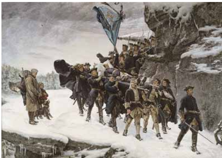
Тело Карла XII уносят с поля битвы. Картина работы Густафа Седерстрёма, 1884 г. Национальный музей, Стокгольм

На исходе августа шведская армия в 40 тысяч человек двумя колоннами перешла норвежскую границу. Одна колонна двинулась на город Тронхейм, а перед основными силами под предводительством Карла стояла задача овладеть крепостями Фредерикстен и Фредерикстад. Поход 1716 г. наглядно показал, что без взятия этих двух крепостей, которые можно было снабжать с моря, попытки захватить столицу Норвегии, Христианию, не имели смысла, ибо, пока обе крепости оставались в руках норвежцев, арьергард шведской армии оказывался слишком уязвимым.