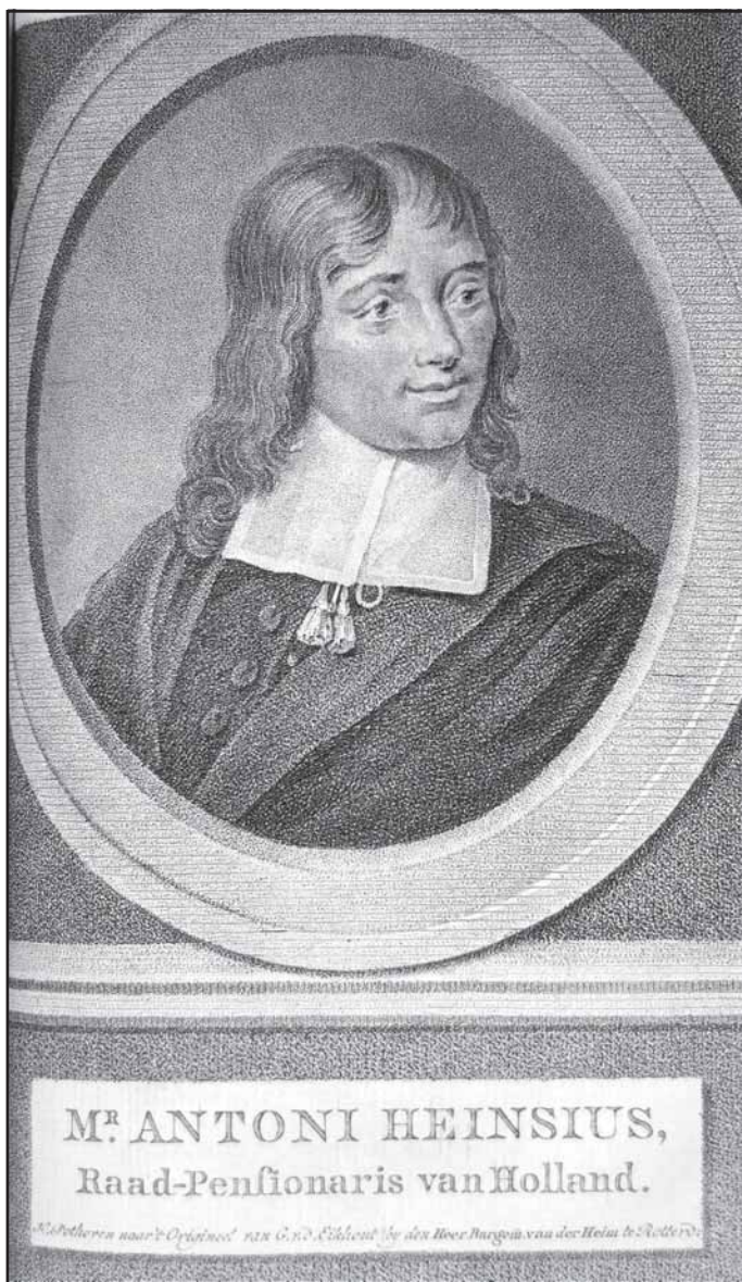
Антони Хейнсийус. Частная коллекция Ханса ван Конингсбрюгге.