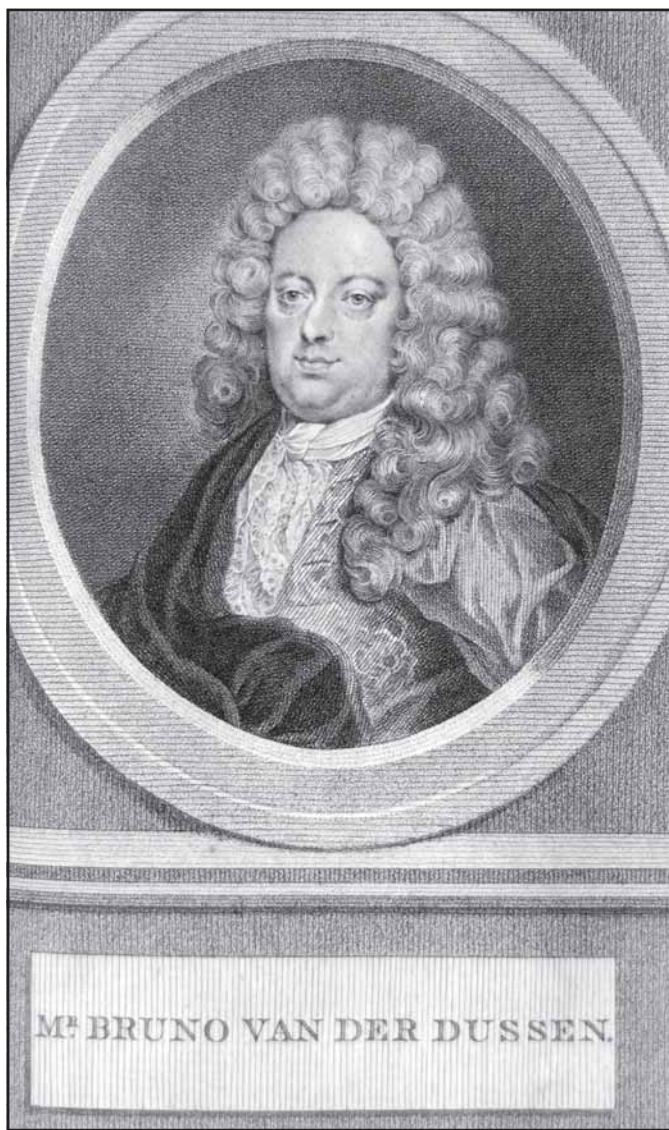
Брюно ван дер Дюссен. Частная коллекция Ханса ван Конингсбрюгге.