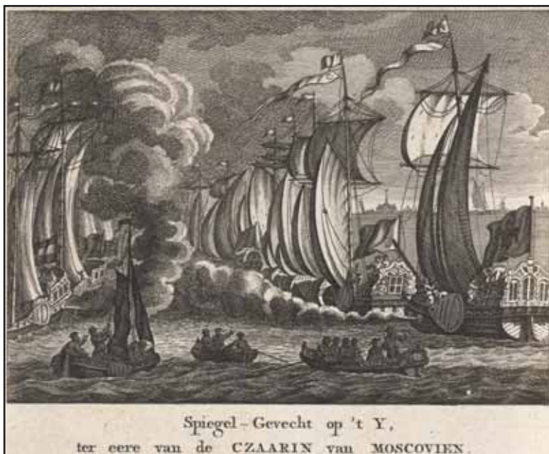
Потешный бой на реке Эй в честь царицы Московской. Гравюра, выполненная, предположительно, Барентом де Баккером по рисунку, приписываемому Херманюсу Петрюсу Схаутену, 1717 г. Государственный музей (Рейксмузеум), Амстердам

Для чего проявлять особую благосклонность к голландским купцам в прибалтийских портах, если господа «Высокомочные» не могут и не хотят давать ничего взамен? И поскольку русские считали гораздо более выгодным поддерживать собственных купцов и предпринимателей, сближение между Петербургом и Гаагой было почти невозможно.