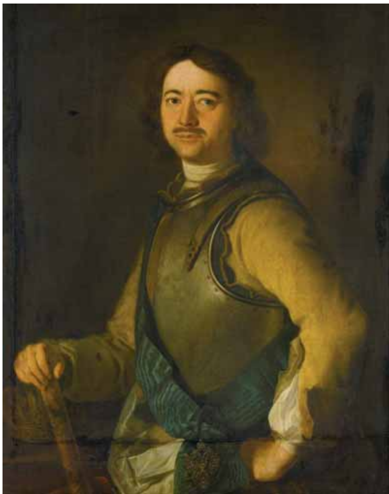
Петр I. Государственный музей (Рейксмузеум), Амстердам