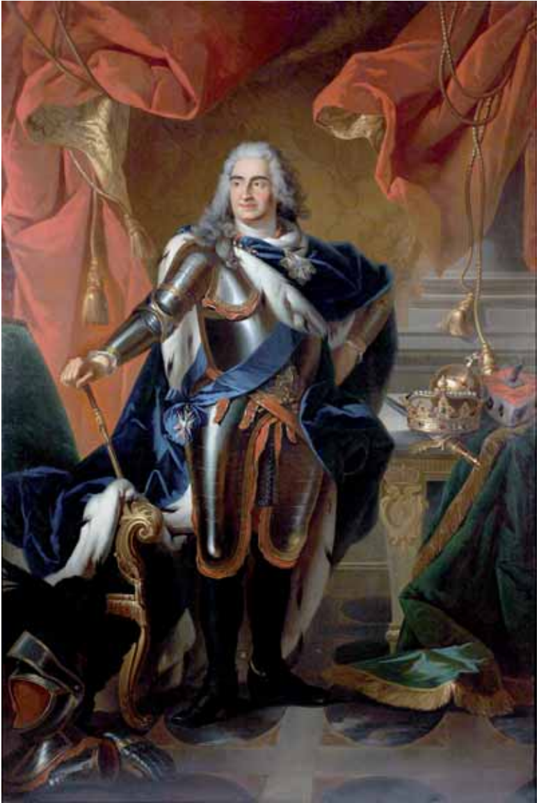
Август II Саксонский и Польский. Портрет работы Генрика Родаковского