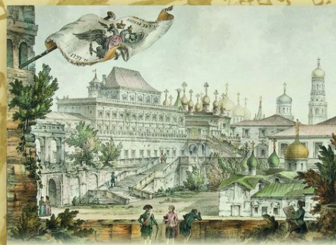
Москва. Кремль. Теремной дворец. Акварель Дж. Кваренги. 1797. 30 мая (9 июня) 1672, в день памяти святого Исаакия Далматского в царской семье родился сын. Его назвали Петром — что по-гречески означает камень, скала. В московском Кремле в окружении многочисленных нянек и кормилиц прошли детские годы будущего императора.