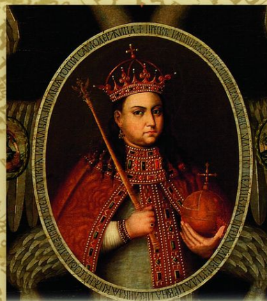
Царевна Софья. Неизвестный художник второй половины XVII века. Софья Романова (1657—1704) — дочь царя Алексея Михайловича от первого брака с Марией Милославской. Сводная сестра Петра I. В 1682—1689 — фактическая правительница при малолетних царях Петре I и Иване V. После Стрелецкого бунта 1689 пострижена в монахини московского Новодевичьего монастыря.