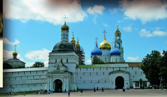
Сергиев Посад. Троице-Сергиева Лавра. В 1682 монастырь послужил убежищем для царевны Софьи и царей Петра I и Ивана V, скрывавшихся от мятежных стрельцов. Во время второго стрелецкого бунта Петр снова укрылся в стенах обители и нашел здесь поддержку в конфликте с претендовавшей на трон Софьей. Отсюда в 1689 он выехал в Москву единовластным правителем.

КОЛОМНА * ПЕСКОВ * СУЗДАЛЬ * БОЛДИНО * ПЕРЕСЛАВЛЬ ВАЛЕСКИЙ * СМОЛЕНСК * ВЫБОРГ