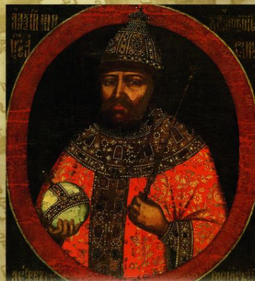
Алексей Михайлович Романов. Неизвестный русский художник второй половины XVII века. Отец Петра I Алексей Михайлович (1629—1676), прозванный «Тишайшим» — второй русский царь из династии Романовых, сын царя Михаила Федоровича от второго брака с Евдокией Лукьяновной (урожденной Стрешневой).