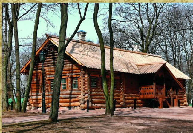
Коломенское. Домик Петра I. Дом был построен в 1702 на острове Святого Марка в устье Северной Двины корабельными мастерами. В нем в течение двух с половиной месяцев жил Петр I, наблюдая за строительством Новодвижской крепости. В 1934 домик был перевезен из окрестностей Архангельска в Коломенское.