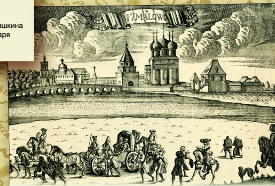
Вид Измайлова. Гравюра И. Ф. Зубова. Конец 1720-х. Много времени юный Петр проводил в Измайлове — одной из подмосковных царских усадеб. Здесь разыгрывались первые баталии его потешных полков. Здесь же в 1688 Петр нашел в амбаре легендарный ботик — «дедушку русского флота», которым быстро научился управлять.