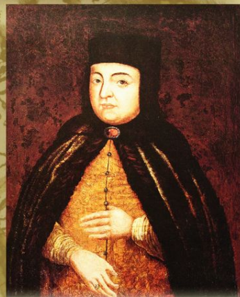
Царица Наталья Кирилловна. Художник П. Н. Никитин. 1698 (?). Мать Петра I Наталья Кирилловна Нарышкина (1651—1694) — царица, вторая жена царя Алексея Михайловича, дочь боярина Кирилла Полузактовича Нарышкина.