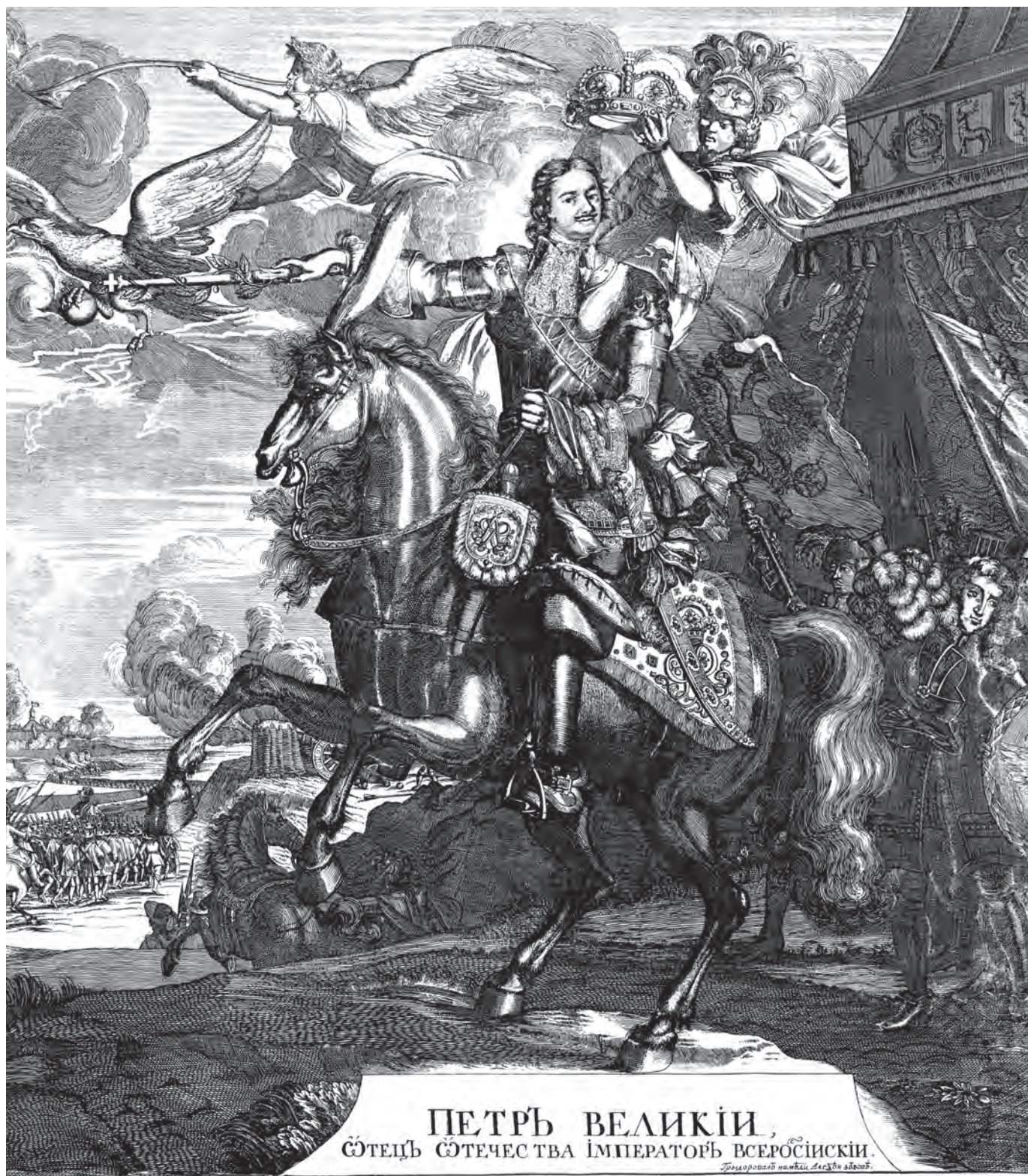
ПЕТРЪ ВЕЛИКІИ, ОТЕЦЪ ОТЕЧЕСТВА ІМПЕРАТОРЪ ВСЕРОСІЙСКІИ.