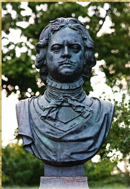
Сестрорецк. Памятник «Петру Великому основателю Сестрорецка» на площади Свободы. Скульптор Б. А. Петров. 2000. Город ведет свою историю со строительства царского летнего дворца и парка в 1714, в 1721 здесь был основан оружейный завод.