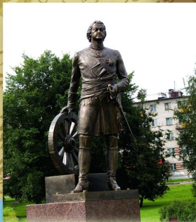
Великий Новгород. Памятник Петру I на пересечении набережной реки Глень и Большой Санкт-Петербургской улицы. Скульптор А. Пшерацкий. 2009. Установлен к 300-летию Полтавской битвы. Новгород был надежным тылом во время Северной войны, и новгородцы принимали участие в сражении под Полтавой.