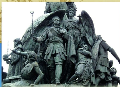
Великий Новгород. Скульптурная группа «Основание Российской империи». Скульпторы М. О. Микешин, И. Н. Шредер. Крылатый ангел указывает Петру I путь на север, к месту будущего Санкт-Петербурга; у ног Петра I поверженный на колени швед.