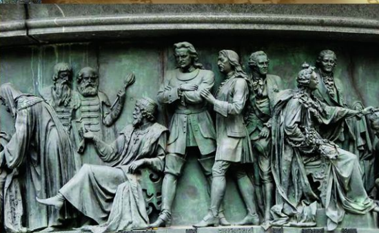
Великий Новгород. Горельеф «Государственные люди» на фризе памятника. Скульптор Н. А. Лаверецкий. Петр I изображен рядом с одним из своих ближайших сподвижников кн. Я. Ф. Долгоруким.