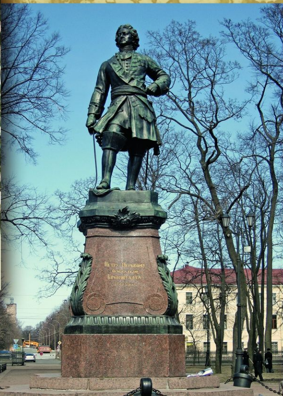
Кронштадт. Памятник Петру I в Петровском парке. Скульптор Т.-Н. Жак. 1841. На постаменте надпись: «Петру Первому основателю Кронштадта» и слова из указа Петра от 1720 года: «Оборону флота и сего места держать до последней силы живота яко наиглавнейшее дело».