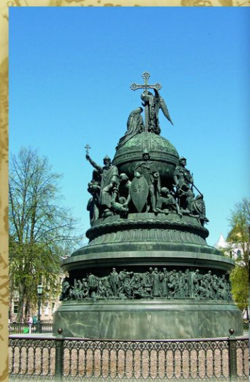
Великий Новгород. Памятник «Тысячелетие России» на Софийской площади. Скульпторы М. О. Микешин, И. Н. Шредер. 1862.