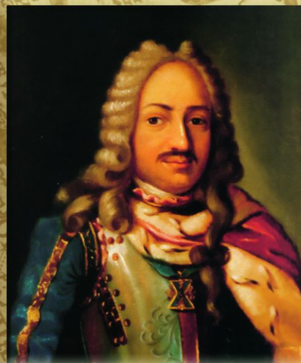
Франц Яковлевич Лефорт (1656—1699). Неизвестный художник. Первая четверть XVIII века. Уроженец Швейцарии, с 1678 находился на русской службе, в 1689 сблизился с Петром I. Во время Азовских походов (1695—1696) командовал русским флотом, в 1695 получил чин адмирала, а в 1697—1698 возглавлял «Великое посольство».