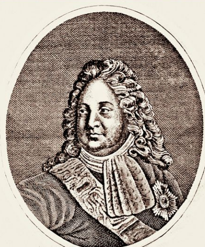
Петр Павлович Шафиров (1669—1739). Гравюра. XVIII в. Внук еврея, принявшего православие, барон и вице-канцлер. Благодаря его дипломатическому таланту русской армии во главе с Петром I удалось избежать пленения турками во время Прутского похода (1711).