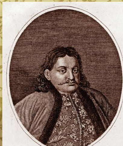
Федор Юрьевич Ромодановский (1640—1717). Гравюра. XVIII в. «Князь-кесарь», руководитель государства во время «Великого посольства» Петра I, с 1686 — глава Преображенского приказа розыскных дел.