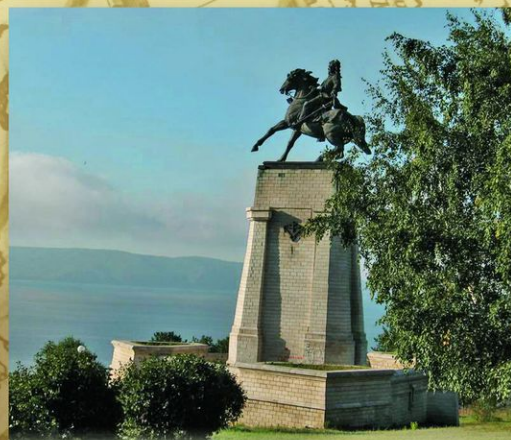
Василий Никитич Татищев (1686—1750). Памятник в Тольятти. Скульптор А. И. Руковишиников. 1998. Государственный деятель, историк, географ и экономист, основатель Екатеринбурга и Перми, а в 1737 — города Ставрополя на Волге (ныне Тольятти).