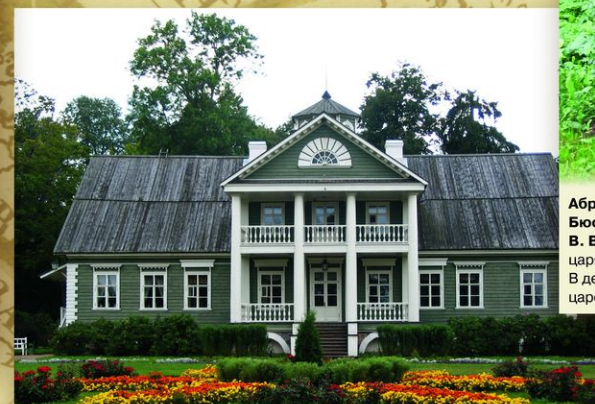
Усадьба А. П. Ганнибала Петровское. Музей-заповедник Пушкинских гор, Псковская обл. Усадьба, позже названная Петровское, была пожалована А. П. Ганнибалу императрицей Елизаветой, при которой он занимал различные государственные посты.

БОЛЬШИЕ ВЯЗЕМЫ * СТАРОДУБ * АЗОВ * ДОЛГОРОЖЬЕ * СНИДА * КАСИМОВ * ПОЧЕП