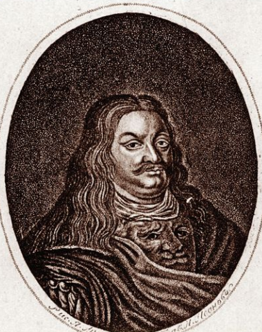
Яков Федорович Долгоруков (1659—1720). Гравюра Н. Г. Иванова по рисунку Я. А. Аргунова. Начало XIX в. Боярин, князь, доверенное лицо Петра I, участник Азовских походов и Северной войны. В 1700—1711 находился в шведском плену. С 1712 — сенатор, с 1717 — президент Ревизионной коллегии.