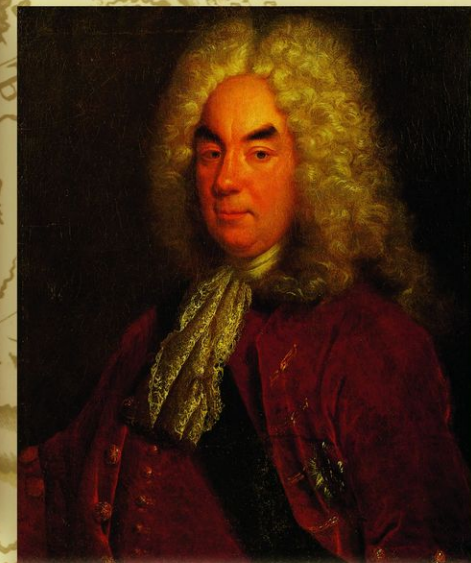
Петр Андреевич Толстой (1645—1729). Художник И. Г. Таннауэр. 1710-е. Дипломат и руководитель царской секретной службы (Преображенского приказа и Тайной канцелярии). В 1716—1717 сопровождал Петра I в поездке по Европе. Основатель графского рода Толстых.