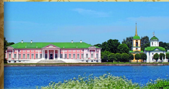
Усадьба Кусково с церковью во имя Происхождения честных древ Животворящего Креста Господня. Москва. Сын Б. П. Шереметева Петр в 1737—1739 построил в родовом имении каменный храм, где хранился золотой крест с частицей древа животворящего креста, полученный, по преданию Б. П. Шереметевым от Папы Римского во время Великого посольства.

ЛОСИНО-ПЕТРОВСКИЙ * БОЛДЫ * ВОЛОГДА * МАЛЫГИН * ФЛОРИЩЕВА ПУСТЫНЬ * РОПША