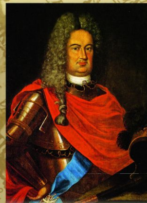
Борис Петрович Шереметев (1652—1719). Художник И. Н. Никитин. 1729. Военачальник и дипломат, генерал-фельдмаршал. Командовал воинскими частями во время Азовских походов и в ходе Северной войны, возглавлял главные силы армии в Полтавском сражении (1709) и в Прутском походе (1711); в числе его заслуг — усмирение Астраханского восстания в 1705—1706 и взятие Риги в 1710.