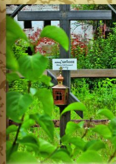
Могила Б. А. Голицына. Флорищевая пустынь, пос. Фролищи, Нижегородская обл.