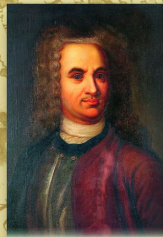
Александр Данилович Меншиков (1673—1729). Неизвестный художник. 1720-е. А. Д. Меншиков — денщик Петра I, ставший его ближайшим сподвижником. Руководил строительством Санкт-Петербурга и Кронштадта. Во время Северной войны командовал крупными соединениями и одержал ряд побед. Граф (1702), светлейший князь (1707), президент Военной коллегии и генералиссимус (1727).