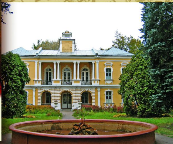
Усадьба Я. В. Брюса. Глинки, Московская обл. Выйдя в отставку в 1726, Я. В. Брюс построил себе усадьбу Глинки в стиле барокко, напоминающую петербургские пригороды.