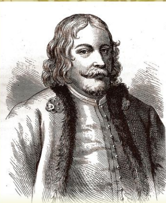
Борис Алексеич Голицын (1654—1714). Гравюра. Середина XIX в. Князь и боярин, воспитатель («дядька») Петра I. В 1694 Петр I пожаловал Б. А. Голицыну бывшую усадьбу Бориса Годунова Большие Вязёмы. Деревянный дворец был перестроен при его вдове в 1784. Князь умер в Свято-Успенской Флорищевой пустыни, приняв монашество под именем Боголепа.

В условиях самодержавия огромное значение имела личность монарха, его мировоззрение, определявшие выбор лиц, приближенных к трону. Чтобы быть замеченным Петром, надлежало соответствовать его взыскательным требованиям. Одна из граней петровского дарования состояла в умении выбирать соратников, угадывать таланты. Благодаря Петру I множество ярких индивидуальностей раскрыли свои способности в самых разных сферах деятельности, стали его сподвижниками — соратниками, соучастниками его свершений, единомышленниками.