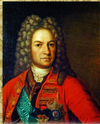
Яков Вилимович Брюс (1669—1735). Неизвестный художник. XVIII в. Государственный деятель и ученый, участник многих петровских начинаний, генерал-фельдмаршал. Автор знаменитого «Брюсова календаря» — настольного справочника российских земледельцев.