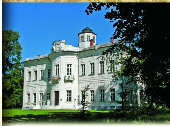
Большие Вязёмы, Московская обл. Усадьба кн. Б. А. Голицына.