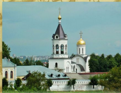
Владимир. Богородицко-Рождественский монастырь (основан в XII веке). В соборе монастыря был похоронен кн. Александр Невский, мощи которого, по воле Петра I, были перенесены в Александро-Невский монастырь в Санкт-Петербурге. На месте снесенного в советские годы монастырского собора в 1990-е годы построен новый.

Отношения Петра I с Православной Церковью были сложными. Царь не пренебрегал обязанностями христианина. В юности, как было принято, посещал известные храмы и обители России. Но постепенно он отходил от ритуальных норм древнерусского благочестия. Приверженец идеи рационализма, Петр считал, что Церковь должна служить интересам государства. Петр создал новую государственную структуру, почти два века определявшую религиозную политику страны — Святейший Синод. В петровскую эпоху было построено немало храмов. В их архитектуре древнерусские традиции постепенно уступают место новым европейским веяниям.