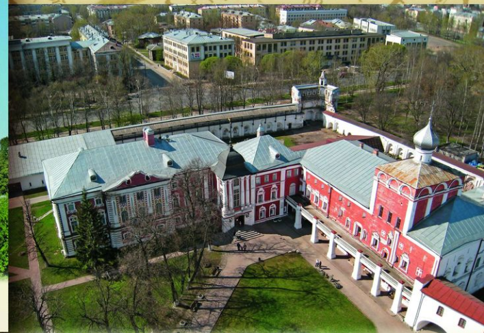
Волгоград. Симоновский корпус Архиепископского двора с церковью Рождества Христова (1667—1670). Во время путешествий в Архангельск Петр I часто останавливался в Волгоде. Вологодское духовенство принимало царя в Крестовой палате Архиепископского двора.