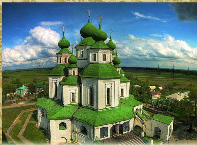
Старочеркасское. Ростовская обл. Воскресенский собор (1706—1719). По преданию, царь заложил несколько кирпичей в алтарную часть собора.