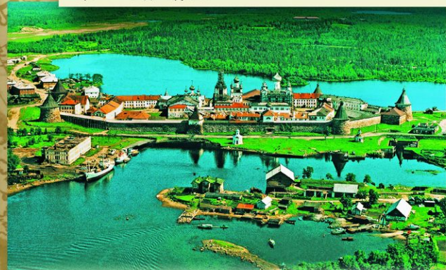
Соловки. Спасо-Преображенский монастырь (основан в XV веке). Первый раз Петр I посетил Соловки летом 1694. Второй визит в августе 1702 был связан с началом активных действий по захвату региона Балтийского моря. Петр I прибыл к островам в сопровождении 13 военных судов, и провел там 6 дней.