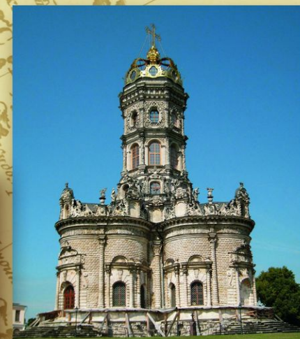
Дубровицы. Московская обл. Знаменская церковь (около 1690—1697). Церковь построена в усадьбе сподвижника Петра I кн. Б. А. Голицына. Петр I давал свои наставления по ее убранству, когда в 1696 останавливался в Дубровицах по пути в Москву после взятия Азова. Оригинальная архитектура церкви смутила духовенство, и ее освящение произошло только в 1704 в присутствии Петра I.