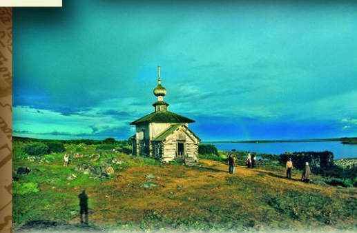
Соловки. Церковь Андрея Первозванного на Заяцком острове (1702). В 1702 Петр I привез на Соловки разобранную церковь, которую матросы собрали на острове Большой Заяцкий, где имел стоянку флот. По преданию, возводя храм, Петр I придумал и утвердил Андреевский стяг — боевой флаг военно-морского флота России.