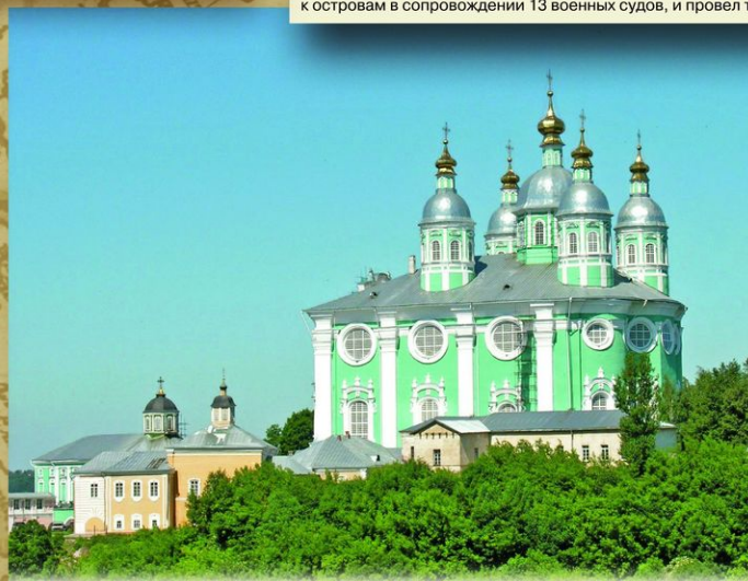
Смоленск. Свято-Успенский кафедральный собор (заложен в 1677, завершён в середине XVIII века). По легенде, чугунные плиты для пола Успенского собора были дарованы Петром I.