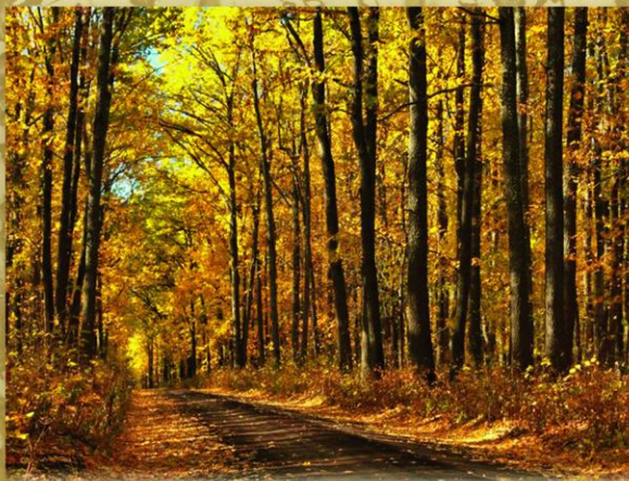
Павловск, Воронежская область. Шипова Дубрава. До сих пор неподалеку от города сохраняется корабельная роща — Шипова дубрава, откуда брали строевой лес для нужд верфи.