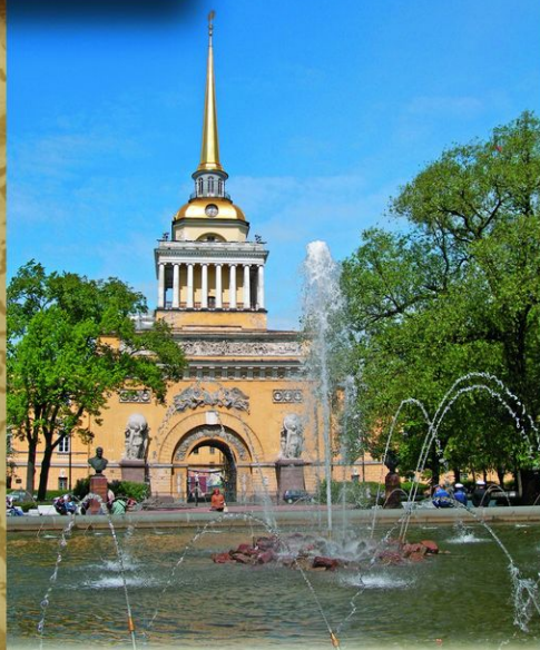
Санкт-Петербург. Адмиралтейство. Современный вид. Идея морской славы России была блестяще воплощена архитектором А. Д. Захаровым, построившим в 1806—1823 новое здание Адмиралтейства. Кораблик на его шпиле стал одним из символов города. С 2009 здесь располагается Главный Штаб Военно-морского флота.