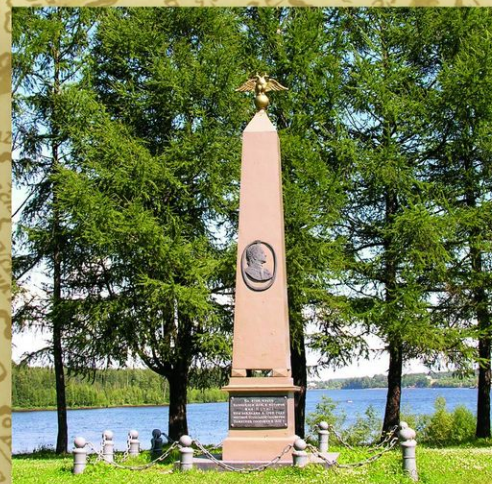
Лодейное поле. Обелиск в честь Петра I. 1832. Поставлен на месте дома, в котором жил Петр I при закладке в 1703 Олонецкой верфи на реке Свирь. До закрытия в 1830 на верфи строились военные корабли для Балтики. Название города означает «поле, где строят суда — лодии».