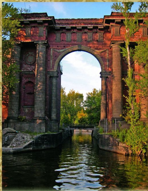
Санкт-Петербург. «Новая Голландия». Здесь на одноименном острове, возникшем в 1720 после прокладки Адмиралтейского и Крюкова каналов, хранился корабельный лес для Адмиралтейской верфи. В 1765—1788 сооружен комплекс каменных складов (архитекторы С. И. Чевакинский, И. К. Герард; фасады — Ж. Б. Вален-Деламот).