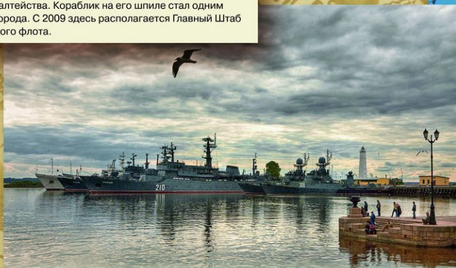
Вид Кронштадта. Город-крепость, заложен в 1704 на острове Котлин посреди Финского залива. Островное положение и близость к Петербургу определили судьбу города, с 1720-х годов служившего базой Балтийского флота.