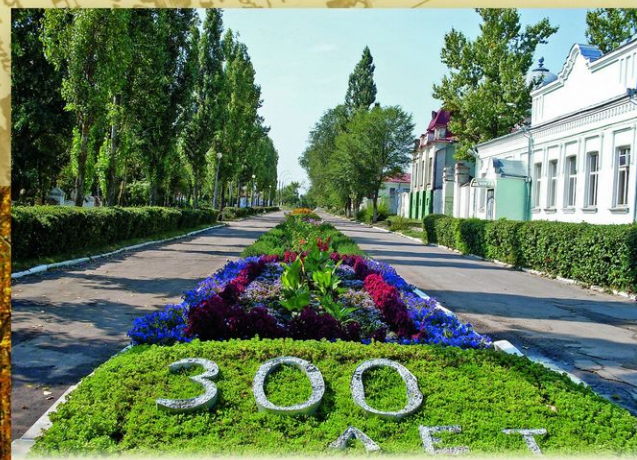
Павловск, Воронежская область. Город был основан в 1709 как крепость в месте слияния рек Осереды и Дона. Строили ее плененные под Полтавой шведы. Сюда из Воронежа была перенесена верфь, на которой строились военные корабли.