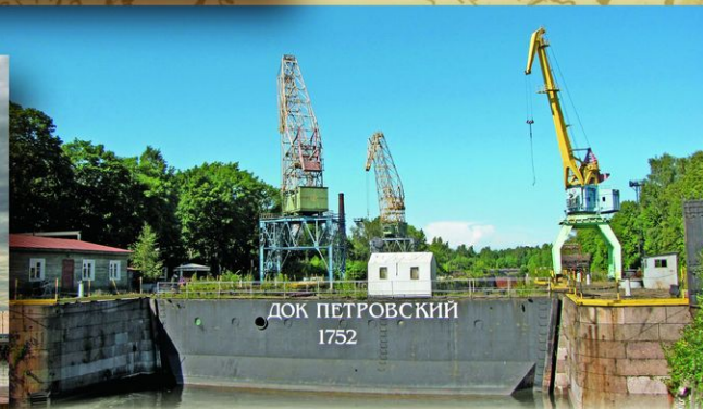
Кронштадт. Петровский Док. Сооружение канала с доком началось в 1719 году при личном участии царя. Однако канал открыли лишь в июле 1752 в присутствии дочери Петра I императрицы Елизаветы Петровны.

РОЖДЕСТВЕНО * БРЯНСК * ДЕРБЕНТ * БОЖИЛОВСКИЙ * СВАТОВ * ТИХВИН * РЯБОВО