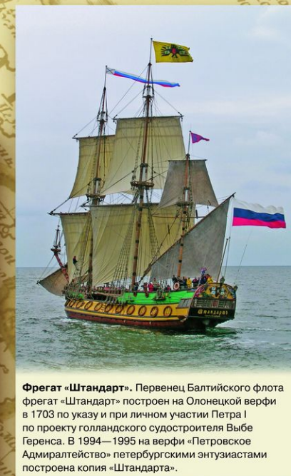
Фрегат «Штандарт». Первенец Балтийского флота фрегат «Штандарт» построен на Олонецкой верфи в 1703 по указу и при личном участии Петра I по проекту голландского судостроителя Выбе Геренса. В 1994—1995 на верфи «Петровское Адмиралтейство» петербургскими энтузиастами построена копия «Штандарта».