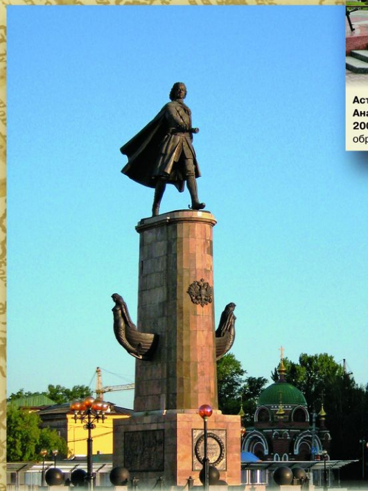
Липецк. Памятник Петру I на площади Петра Великого. Скульптор В. М. Клыков. 1996. Установлен к 300-летию Российского флота. Слобода Липецкие заводы была основана в 1703 по указанию Петра I.