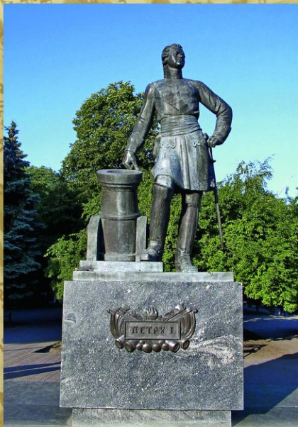
Азов. Памятник Петру I на Петровском бульваре. Скульптор О. К. Комов. 1996. Установлен к 300-летию Российского флота.