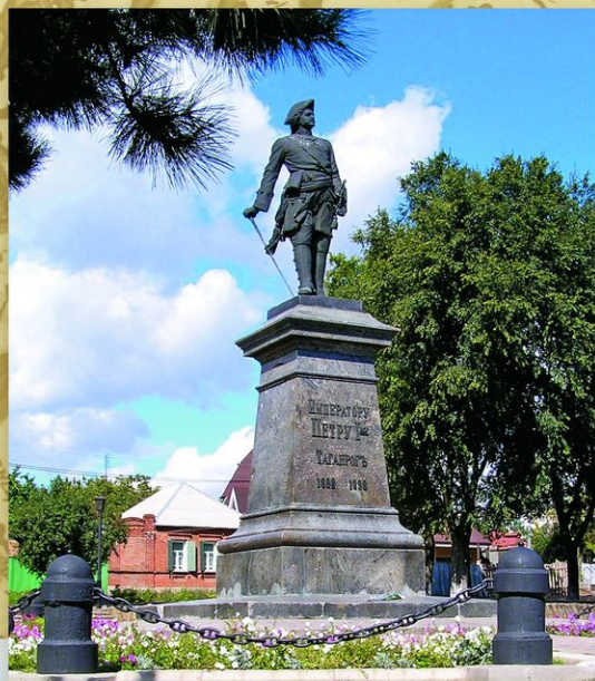
Таганрог. Памятник Петру I у порта. Скульптор М. М. Антокольский. 1903. Петр I изображен в мундире офицера Преображенского полка. По этой же модели созданы памятники в Петергофе в Нижнем парке (1884), Санкт-Петербурге перед Сампсониевским собором (1909), Архангельске (1914), Шлиссельбурге (1953).