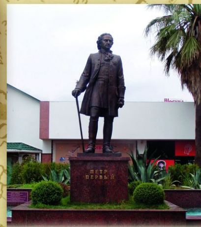
Сочи. Памятник Петру I у причала морского порта. Скульпторы А. Бугаев и В. Звонов. 2008. Петр I никогда не был в Сочи, но город, как самый южный морской форпост России, посчитал необходимым иметь своего Петра.

ВЫГОЦК * ЛАРФИНО * ЛИПЕЦК * ВОРОНЕЖ * БОРИСОВКА * КОМЫВАНЬ * ВЕРХНИЙ ТАГИЛ