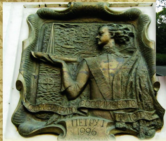
Нижний Новгород. Барельеф «Петру I — основателю Российского флота. 1696—1996. Нижегородцы». Установлен в 1996 на ДOME Чатыгина, где Петр I останавливался дважды: первый раз — в 1695 перед Азовским походом, второй раз — в 1722, когда приезжал в город для посещения могилы Кузьмы Минина.