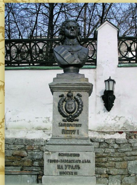
Екатеринбург. Памятник Петру I во дворе Музея истории архитектуры и промышленной техники Урала. Скульптор Г. Чехомов. 1992. Реконструкция на прежнем постаменте памятника (создан в 1886), утраченного в годы революции.