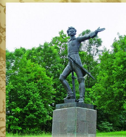
Переславль-Залесский, Ярославская обл. Памятник «Юный Петр на Плещеевом озере» в селе Вельсково у Музея-усадьбы «Ботик Петра Первого». Скульптор В. Казачок. 1992. Установлен к 300-летию Российского флота.