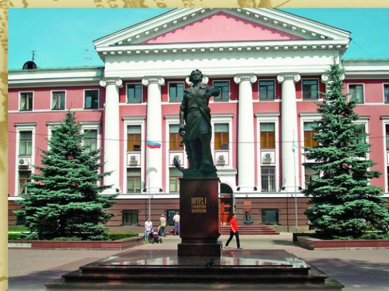
Калининград. Памятник Петру I в сквере у штаба Балтийского флота. Скульптор Л. Е. Кербель. 2003. Установлен к 300-летию Балтийского флота. На постаменте надпись: «Петру I — основателю флота России».