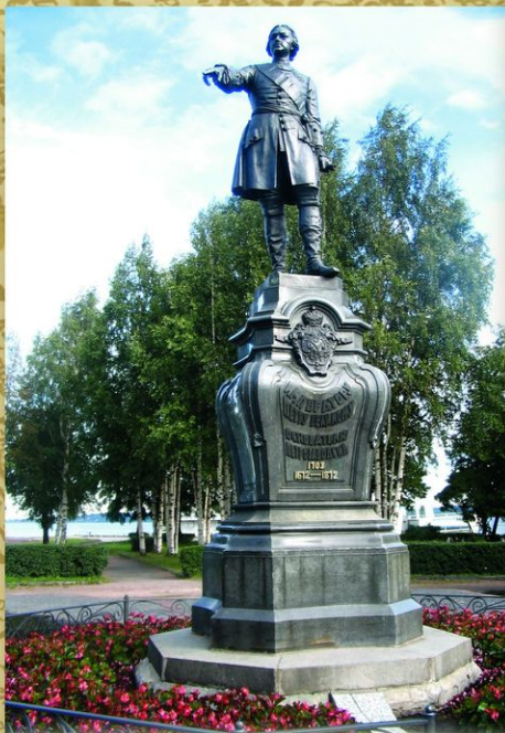
Петрозаводск. Памятник Петру I на Онежской набережной. Скульптор И. Н. Шредер. 1873. Установлен к 200-летию со дня рождения Петра I и 100-летию Александровского завода.