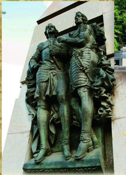
Москва. Горельеф «Петр I и Франц Лефорт» на обелиске у главного входа в Лефортовский парк. Скульптор В. А. Суровцев. 1999. Обелиск установлен к 300-летию местности Лефортова, получившей свое название от имени сподвижника Петра I.