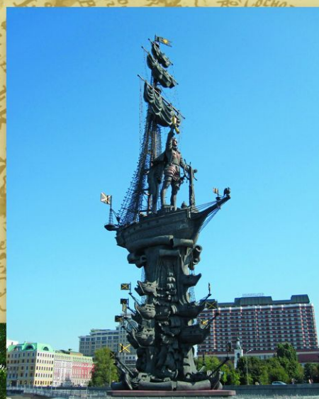
Москва. Памятник Петру I на Москве-реке («В ознаменование 300-летия российского флота»). Скульптор З. К. Церетели. 1997. Высота монумента 98 метров.