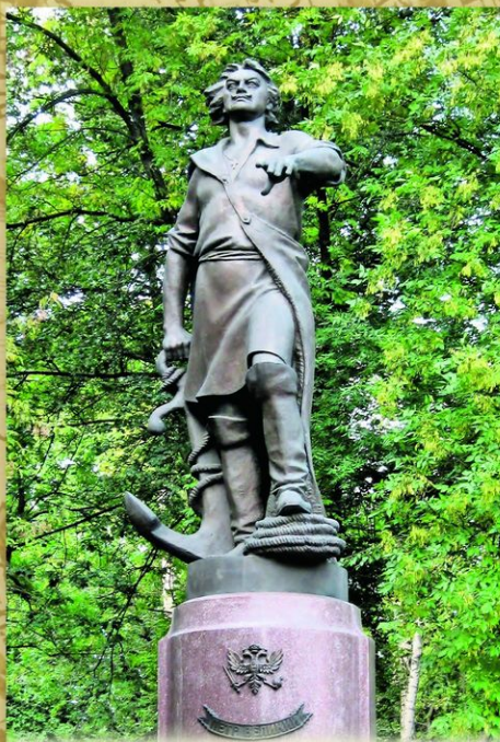
Москва. Памятник Петру I на Серебряных прудах в Измайловском парке. Скульптор Л. Кербель. 1998. В Измайлово Петр обнаружил небольшой английский бот «Святой Николай», на котором он приобрел первые навыки управления кораблем. Теперь этот бот известен как «Дедушка русского флота».